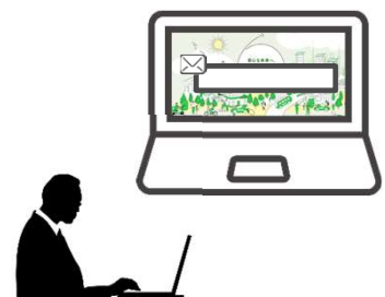
助成対象者または手続代行者