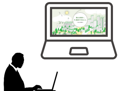
助成対象者または手続代行者